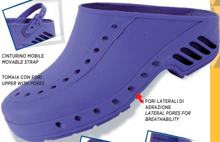
FORI LATERALI DI AERAZIONE LATERAL PORES FOR BREATHABILITY