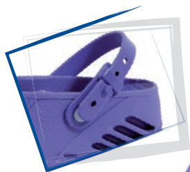
CINTURINO MOBILE MOVABLE STRAP